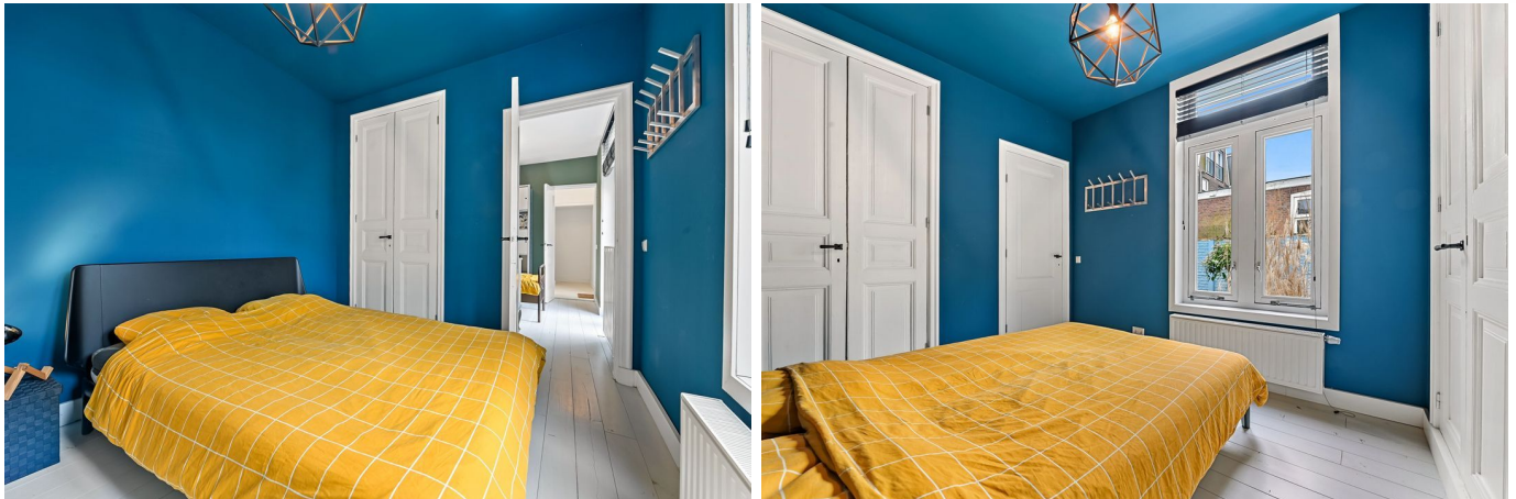
Copernicusstraat 71, 's-Gravenhage